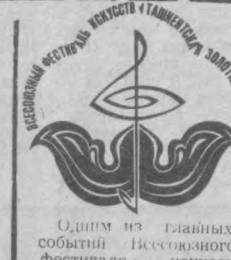
Одним из главных событий Восьмого фестиваля искусств

Много интересного рассказали и гости. А затем за импровизированный дирижерский пульт стал народный артист СССР, лауреат Ленинской премии Евгений Светланов. С огромным успехом прошел концерт оркестра на «Узбексельмаше». Он надолго запомнится и исполнителю, и заводчанам.