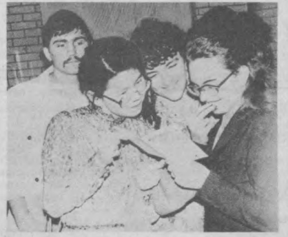
НА СНИМКЕ: вот так заинтересованно обсуждают спектакль зрители.

Далее театр представит зрителю работы своего текущего репертуара и завершит сентябрьские выступления премьерой