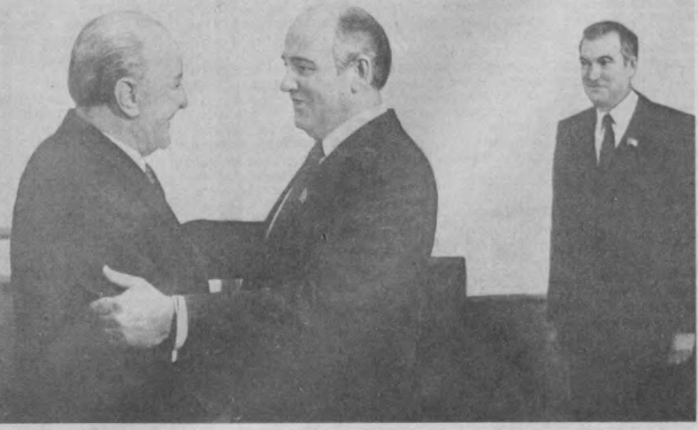
НА СНИМКЕ: перед началом беседы.