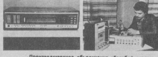
Производственное объединение «Голубой экран».

У «ТЕМПА» — ТЕМП! Так работают специалисты нового завода «Темп» на массиве Черданцева-2 по ремонту телевизоров цветного и черно-белого изображения. Принимать заявки — с 8 до 20.00, номера телефонов будут сообщены дополнительно. Владельцам аппаратуры предоставляется транспорт для доставки телевизоров в ремонт и обратно на дом. Если ремонт телевизора не сложен, линейная служба выполнит вашу заявку в летнее время с 11 до 22.00, в зимнее — с 11.00 до 18.30. Напомним адрес филиала: «МАЯК» (ул. Пушкина, 65) — ремонт магнитофонов, радиоприемников, транзисторной бытовой радиоэлектронной аппаратуры, ремонт малогабаритных телевизоров черно-белого и цветного изображения. Работает с 8 до 20.00, без перерыва и выходных дней. Телефоны: 34-01-61, 33-17-56. Телеателье на ул. Новомосковской, 31 ликвидировано. «ВЕГА» (Луначарское шоссе, 214 «а») — ремонт телевизоров черно-белого и цветного изображения, транзисторной бытовой радиоэлектронной аппаратуры. Работает с 9.00 до 18.30, без перерыва и выходных дней. Филиал завода — на массиве Карусь-4, дом 2 — ремонт черно-белых и цветных телевизоров. Работает с 9 до 18.00, перерыв — с 13 до 14.00, выходной день — понедельник. Завод «Темп» и его филиалы обслуживают только жителей Куйбышевского района. Дополнительные справки по телефону 0-65.