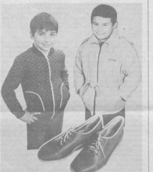
Ташкентская межобластная база «Узобувторг» (телефон 96-32-71).