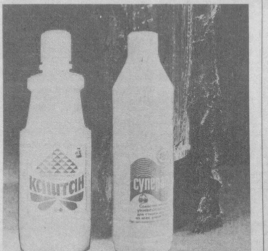
ВНИИХимпроект. Узбекское рекламное агентство В/О «Союзторгкларам» (телефон 45-37-24).

Эти средства пригодны также для мытья различных предметов домашнего обихода, полов и стен.