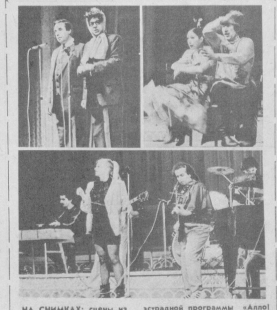
НА СНИМКАХ: сцены из эстрадной программы «Алло! Говорит Вероника Мавриковна!».