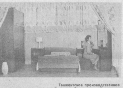
Ташкентское производственное мебельное объединение «Ташкент».

Если вы решили приобрести «Щару», покупка не доставит вам никаких хлопот! Для этого достаточно сделать в магазине заказ, и мебель доставят в установленное время к вам домой.