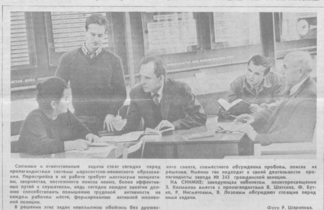
Перестройка в действии

Уйдя в запас, журналист не изменил своей излюбленной теме. И результатом его работы стала книга «Сиреневый зной», рассказывающая о войнах, которые в трудных условиях гор и пустынь достойно выполняют свой воинский и интернациональный долг. (ТАСС.)