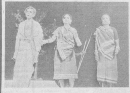
Танир обладатель многих наград — он удостоен стипендии имени Д. Неру, почетной докторской степени музыкального университета Индра Капа, высшей награды правительства штата Мадхья-Прадеш — «Шиншар Самман». Он по праву считается мастером-новатором и выдающимся деятелем мирового театра.

С большим успехом на сцене театра имени Хамзы проходила гастроль «Нового театра» из Индии. Ташкентский зритель посмотрел спектакль «Чарандас — вор». Этот театр был основан в 1959 году режиссером Хабибом Таниром. В него вошли мастера фольклорного искусства штата Мадхья-Прадеш. В творческом коллективе ежегодно осуществляются три постановки, с которыми артисты разъезжают по различным районам Индии с гастрольными пьесами «Чарандас — вор» в обработке и постановке Х. Танира — веселая народная сказка с музыкой, песнями, танцами. Спектакль послужил основой для недавно снятого полнометражного художественного фильма.