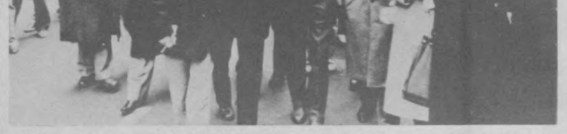
ПАРИЖ. Многолюдная демонстрация трудящихся против одобренного Национальным собранием законопроекта «О регулировании рабочего времени» состоялась во французской столице.

СОФИЯ. Жемчужина болгарского Черноморья — старинный город Несебр, расположенный на острове, вступил в новый год, знаменитый своим архитектурным наследием.