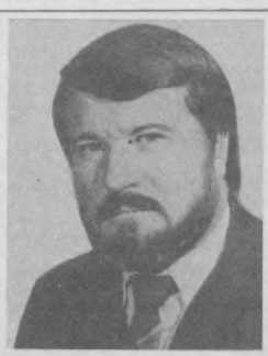
Наша беседа — с заслуженным артистом Узбекской ССР Валерием ЦВЕТКОВЫМ.

Широта и страсть души, редкий исполнительский талант... Творческий почерк этого артиста хорошо известен многим любителям театрального искусства.