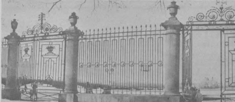
Неизвестное об известном