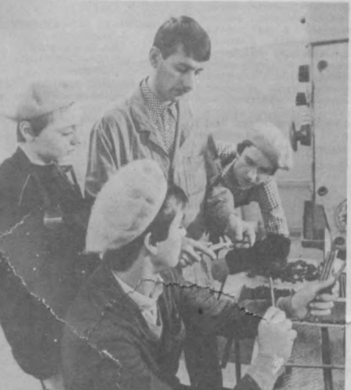
Школьная реформа поставила задачу по организации трудовой подготовки и воспитания учащихся...