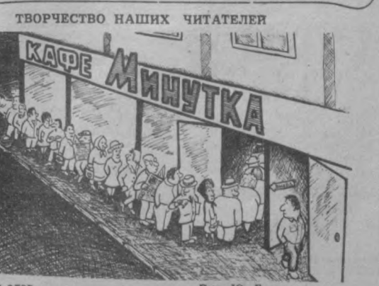
Без слов. Ляс. Ю. Галимова.