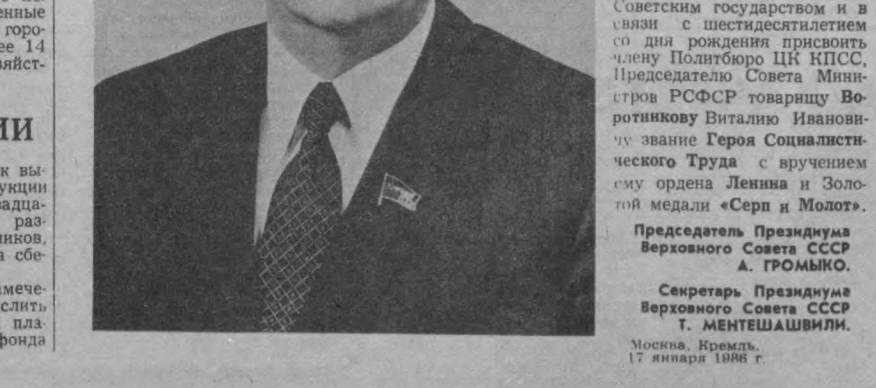
Воротников Виталий Ивановичу звание Героя Социалистического Труда с вручением ордена Ленина и Золотой медали «Серп и Молот».

О присвоении звания Героя Социалистического Труда товарищу Воротникову В. И.