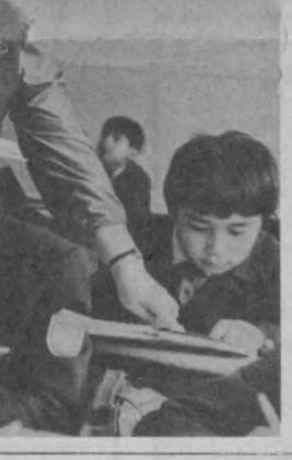
Особое внимание уделяется высокому уровню преподавания каждого предмета, глубокому усвоению учащимися основ наук и их связи с жизнью, формированию коммунистических убеждений, трудолюбия, воспитания учащихся в духе социалистического интернационализма.

Большая работа по совершенствованию учебно-воспитательного процесса проводится в школах города в свете требований Основных направлений реформы общеобразовательной и профессиональной школы.