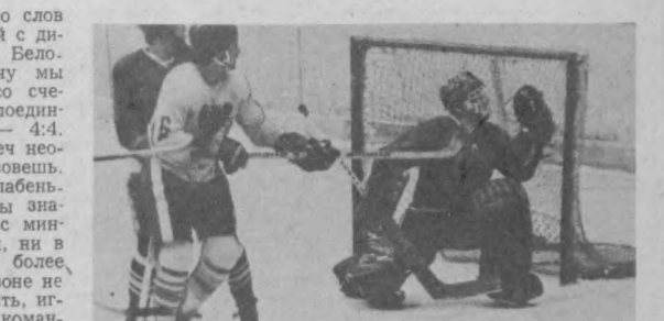
Скажу несколько слов о первой серии матчей с динамовцами столицы Белоруссии. Первую встречу мы уступили минчанам со счетом 3:5.