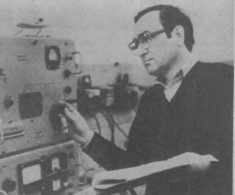
Ударно несет предсъездовскую вахту коллектив Республиканского центрального телеграфа. Немало ценных предложений по внедрению новой техники, совершенствованию производства внесли работники этого производственной лаборатории.

ва КПСС с предлагаемыми изменениями и новой редакцией Программы КПСС и 387 — по проекту Устава КПСС с предложениями изменениями.