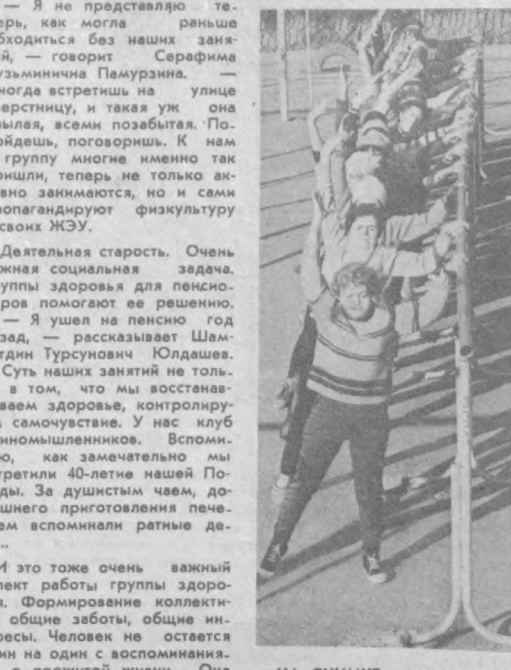
НА СНИМКЕ: группа здоровья пенсионеров занимается на специальной площадке с нестандартным оборудованием.

фильмы: 16.25 «Ромен Роллан. Из воспоминаний». 17.20 Концерт. 18.00 «Современный мир и рабочее движение».