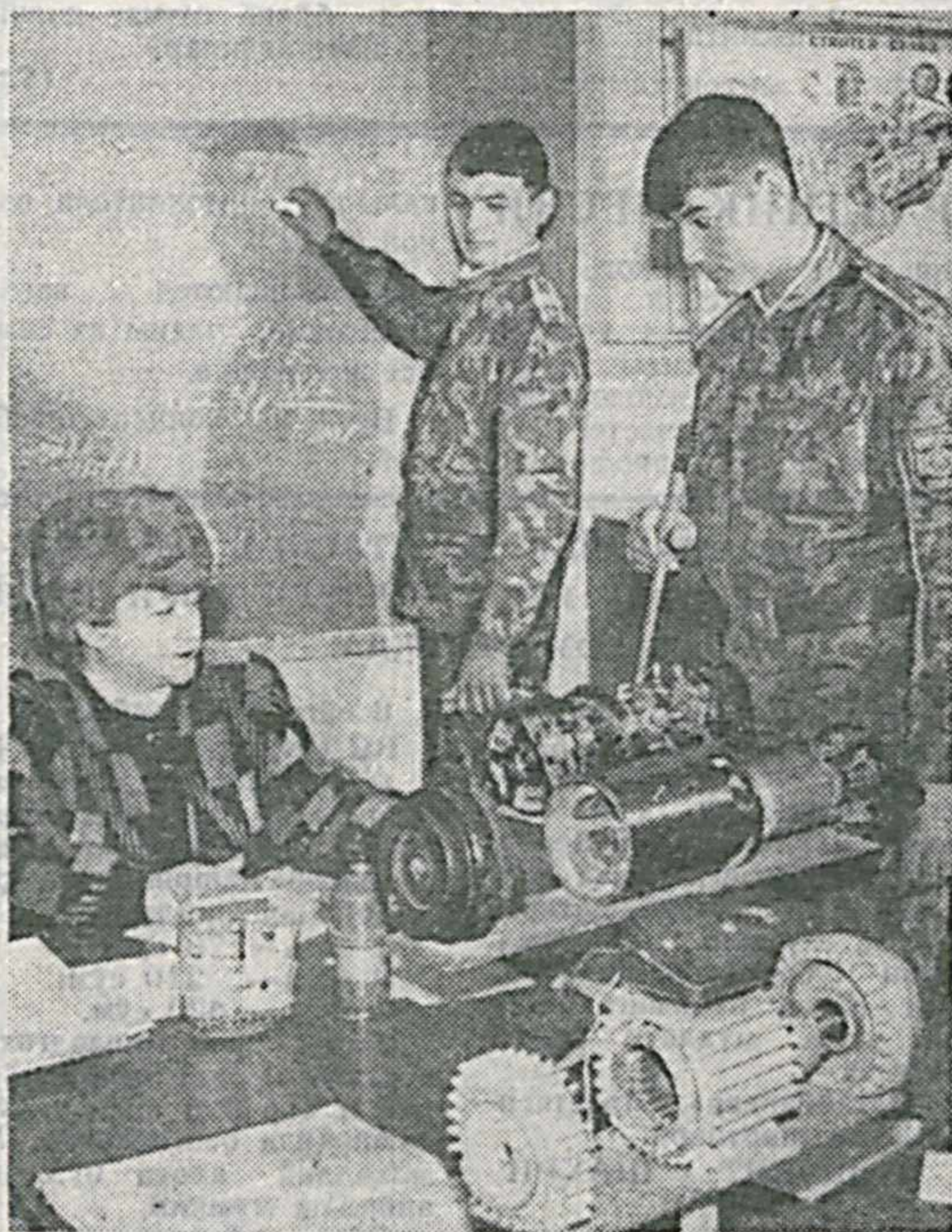
В Самаркандском ВВАКУ такие предметы, как основы электротехники и электроники, помогают будущим офицерам уверенно осваивать самые передовые технологии и перспективные машины.