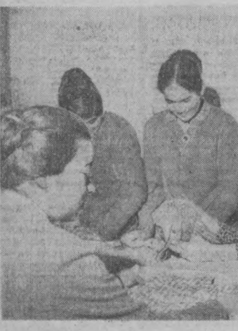
На снимке: на занятиях кружка кройки и шитья.

КАРШИ. В хозяйствах Кашгарской области подведены итоги внедрения в производство нового перспективного сорта хлопчатника «133», выведенного селекционерами Андриановской области. В прошлом году он высеивался на первых 400 гектарах и дал высокие результаты. Хлопок этого сорта по прочности и длине волокна близок к длинноволокнистому и районирован в колхозах и совхозах этой области. Особенно пригоден к нему природные условия Кашгарской и Гузарской степей, где почвы, климатические условия благоприятствуют его быстрому созреванию. Воду посевам даст Памирское водохранилище, строительство которого уже завершено, и прокладываемый сюда Каршинский магистральный канал.