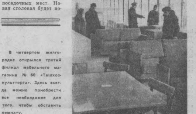
В четвертом жилищном квартале третьего года пятилетки открылся третий филиал мебельного магазина № 60 «Ташкоммунторг». Здесь всегда можно приобрести все необходимое для того, чтобы обставить комнату.

Этой цифрой работы экспериментально-механического завода открыли лицевой счет продукции третьего года пятилетки. Предприятие наметило выпустить более 6 тысяч тонн нестандартного оборудования и технологической оснастки для заводов Стройиндустрии.