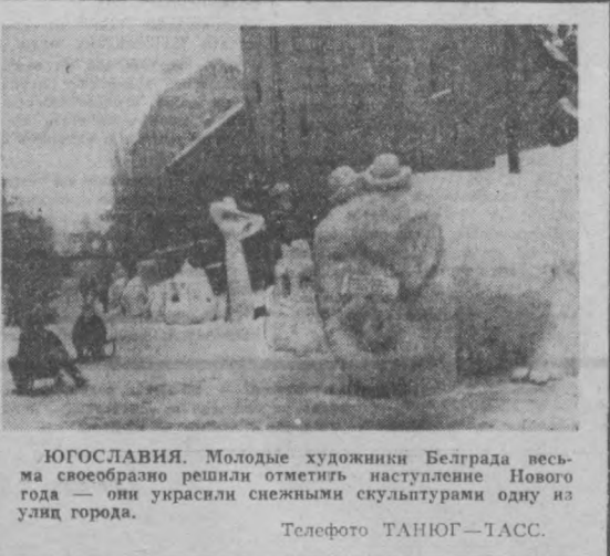
ЮГОСЛАВИЯ. Молодые художники Белграда весьма своеобразно решили отметить наступление Нового года — они украсили снежными скульптурами одну из улиц города.