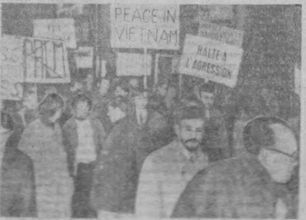
В Южном районе демонстрация в поддержку мирных сил вьетнамцев. Участники демонстрации требовали прекращения бомбардировок территории ДРВ, вывода войск США из Южного Вьетнама.

Как заявил в столице Замбези представитель партии Африканский Национальный Союз Замбабе (АНЗУ), в упорных боях патриоты Зимбабве нанесли тяжелые потери войскам СМТА.