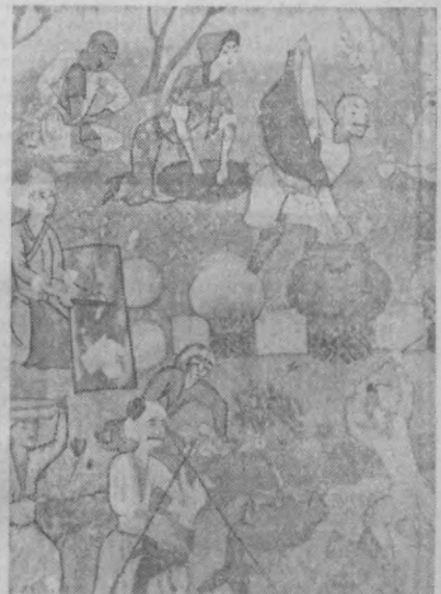
Копия с миниатюры XV века «Приготовление к празднику».