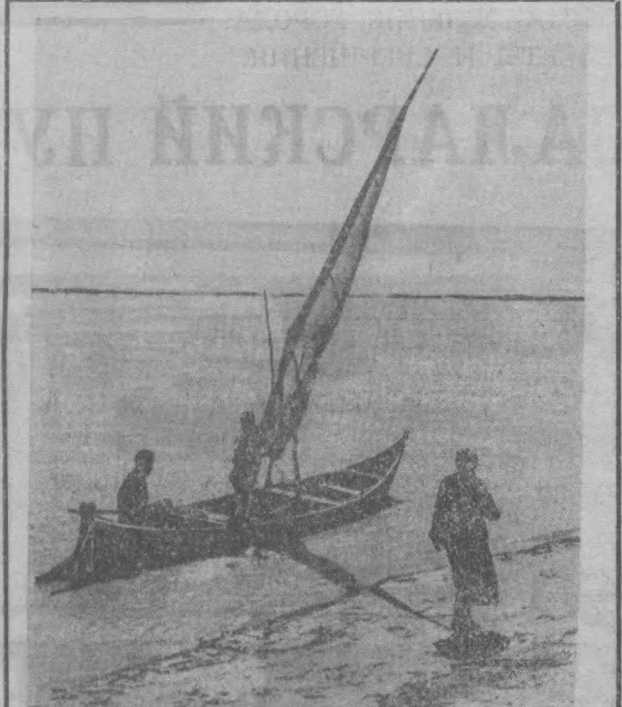
НА СНИМКЕ: НА АМУДАРЬЕ.

На проспекте «Дружба народов» открыт магазин-салон по продаже граммофонных пластинок. Любители музыки смогут здесь приобрести пластины, выпускаемые Всесоюзной фирмой «Мелодия», а также записи классической музыки, эстрады и литературные произведения.