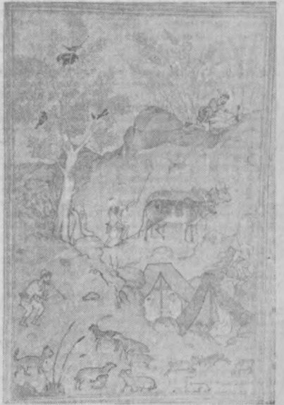
Копия с миниатюры XV века «Земледельческий труд».