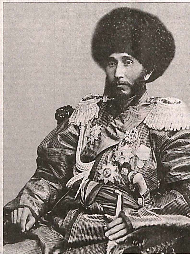
Эй сабо, тобсанг маҳал гар ул паризод олдида, Гоҳ-гоҳи айла бу девонани ёд олдида. Булардан ташқари Фаррух ғазаллари ичида Навоий, Фузулий, Исфаҳидиёрхоннинг маълум

Албатта, шоир ижодиётининг тақомилга эришишида салафлар асарларининг ўрни муҳим бўлган. Масалан: Эй сабо, ҳолимни изҳор айла дилдор олдида, Розини пиҳдонини ифшо этма ағёр олдида, мисралари Оғаҳийнинг қуйидаги матлаби таъсирида битилганлиги сезилади: