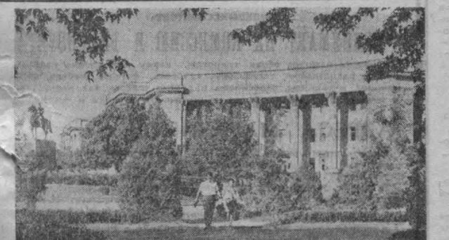
Один из живописных районов узбекской столицы — площадь имени М. В. Фрунзе.