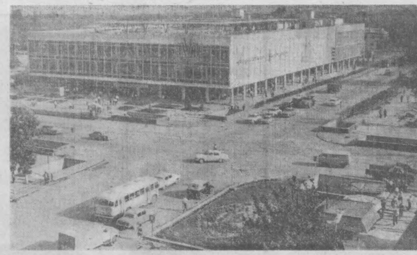
Панорама Центрального университета Ташкента.