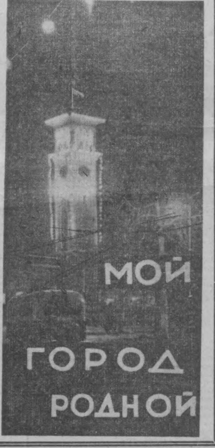
МОЙ ГОРОД РОДНОЙ

Лучшие фотоснимки будут опубликованы в газете. Срок конкурса — до 1 января 1967 года. Поступившие снимки не возвращаются и не рецензируются.