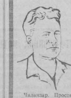
Чиланзар, Проспект «Дружба». Квартира «Б». 1 июля 1966 года.

да. Строительная площадка последняя в Украине. Сюда со всех товарищеских станций Ташкента рывком двинулись бригады «МАЗЫ» и «ЗИЛЫ» со строительными материалами. Рокочут бульдозеры и экскаваторы: краны, похожие на антоны, легко подкапывают с машин бадью и чаны. Идет сорок четвертый день битвы луганцев, подвиги братскую руку помощи ташкентцам.