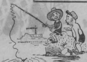
— Тащи, клевет! — Эх ты, это же землетрясение клевет...

Жена. Какой улов был у тебя вчера? Муж. Я поймал шесть лещей. Жена. Значит, нас обманули: мне принесли счет за восемь штук.