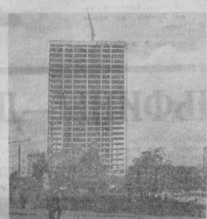
25-этажный дом сооружается на Ленинградском проспекте столицы нашей страны.