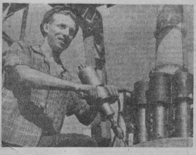
Коллектив монтажников ТашГРЭС обаялся закончить монтаж пятого турбогенератора в этом году.