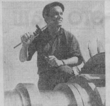
Строители и монтажники Ташкентского ГРЭС приступили к монтажу пятого турбогенератора. Они взяли обязательство сдать в эксплуатацию его в этом году.

За достигнутые успехи в выполнении заданий семилетнего плана Президиум Верховного Совета СССР Указом от 4 июля 1966 года награждает орденами и медалями СССР большую группу рабочих, инженерно-технических работников и служащих предприятий и организаций Министерства машиностроения для легкой и пищевой промышленности и бытовых приборов СССР, работников партийных, советских, профсоюзных и комсомольских организаций.