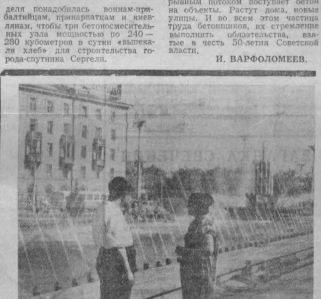
На снимке нашего фотокорреспондента фонтан на Космопольской площади. Вечером здесь более оживленно. Влюбшки выведут сюда влюбчат в колесках. Молодые придут отдохнуть после трудового дня.