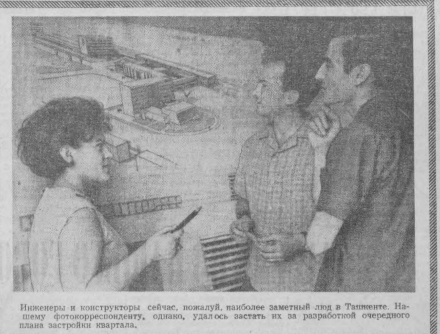
Инженеры и конструкторы сейчас, пожалуй, наиболее заметный люд в Ташкенте. Нашему фотокорреспонденту, однако, удалось застать их за разработкой очередного плана застройки квартала.