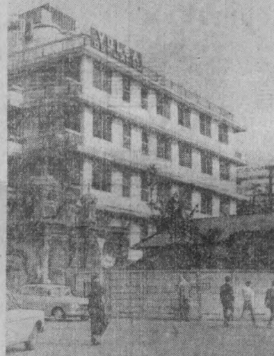
Точно. Русский ресторан «Волга». Для создания «полорита» и в целях рекламы вход в ресторан оформлен в виде церкви.