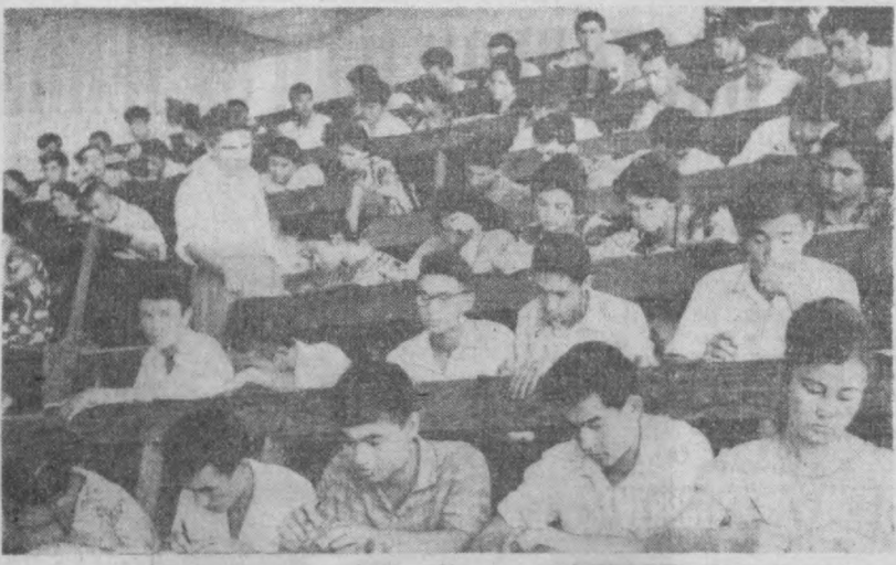
На экзаменах в Ташкентском государственном университете имени В. И. Ленина.