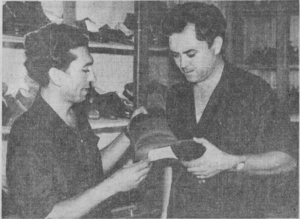
Лето в разгаре, а на обувной фабрике № 1 уже думают о предстоящей зиме. Ташкентские модельеры разрабатывают ассортимент мужских и женских утепленных ботинок.

Не чемпионы мира по футболу — самое напряженное время. Вступил в силу жесткий кубковый закон. Ничья не может быть. Кто проиграет — тот выбывает. Советские футболисты, обыграв в четвертьфинале сборную Венгрии со счетом 2:1, впервые за все чемпионаты мира вышли в полуфинал. Сегодня в полуфинале наша сборная встретится со сборной ФРГ.