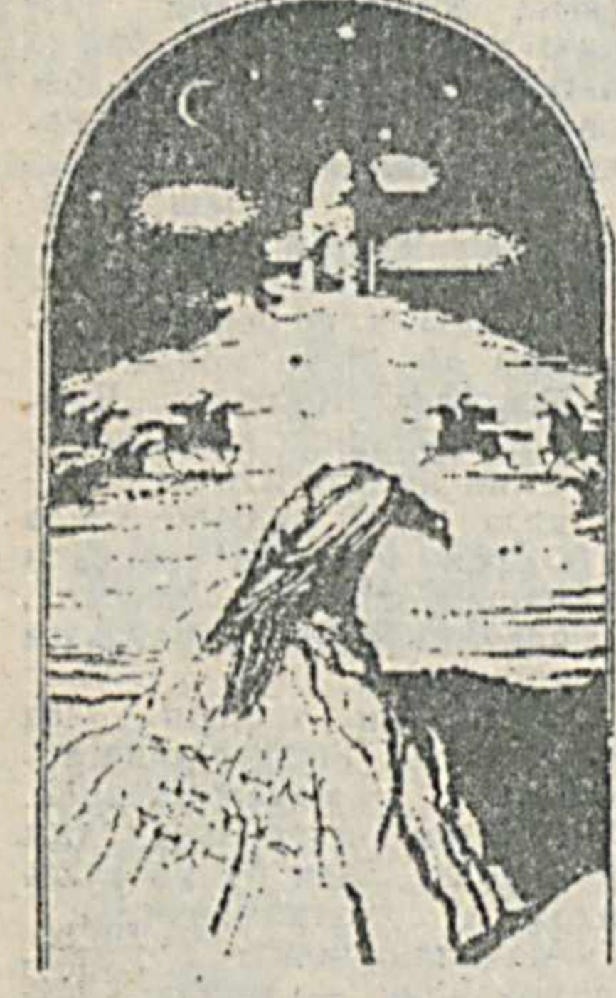
(Давоми Боши газетанинг 83-сонда)

УГДУЛМИШ ЭЛИГГА ЛАШКАРБОШИ ҚАНДАЙ СИФАТЛАРГА ЭГА БУЛИШНИ АЙТИШИ ҲАҚИДА