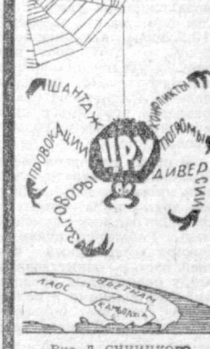
Рис. Д. СИННИКОВО.