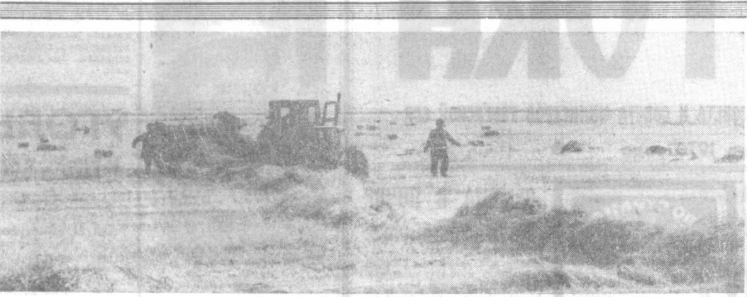
В госплемзаводе «Нисан» Каршинского района идет заготовка сена. На участок «Наур» вышло 16 семеновских. Животноводы рещили завершить заготовку сена с площади 2.200 гектаров в кратчайший срок. На снимке: прессовка сеножного сена.

Ю. КУЗЬМИН. Соб. корр. «Правды Востока». Бухарская область.