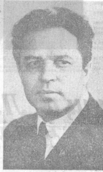
Е. М. Тяжелый, первый секретарь ЦК ВЛКСМ