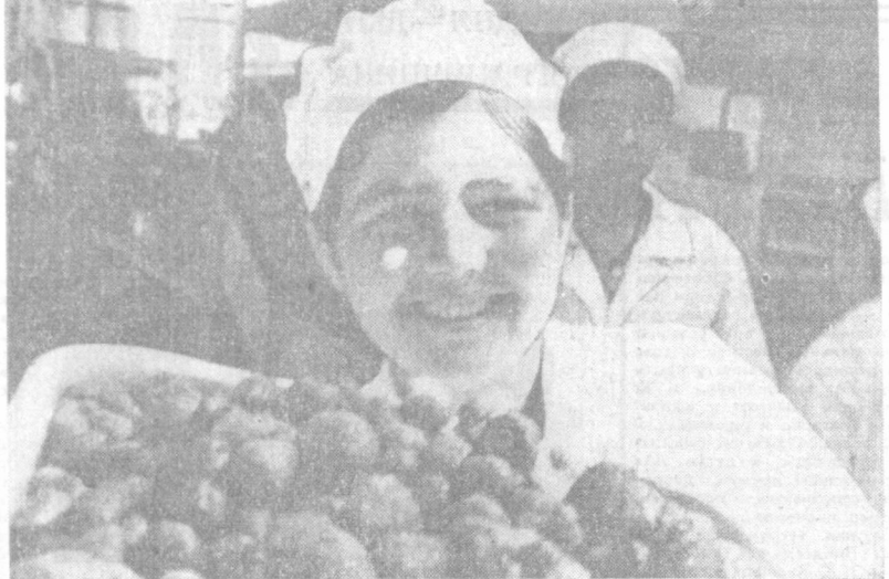
На Янгильском консервном заводе началась переработка клубники нового урожая.

Тесен Кабул. Слышимый след от молот об этом забыть. Все видно в Кабуле. Махмудбек на базаре поглаживал шероховатые красные копыта. Торговец знал, что это не покупатель. Но знал и другое: друг купца Аскаралы. Начался долгий, затянувшийся разговор о ценности арбу. (Продолжение. Начало в «Правде Востока» за 24 и 27 мая.)