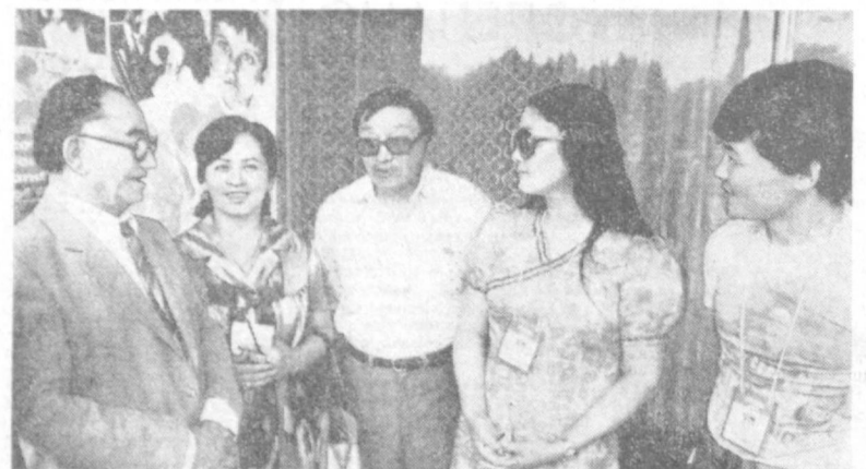
На снимке: народный артист СССР Ш. Бурханов среди монгольских кинематографистов — кинофестиваля стран Азии, Африки и Латинской Америки.