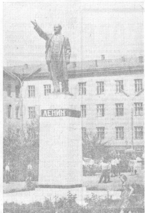
Памятник В. И. Ленину перед зданием Фрунзенского политехнического института.