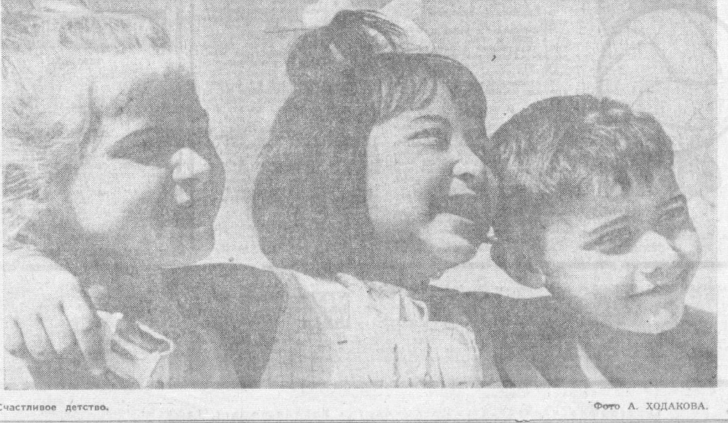
Счастливые дети.

Только по социальному страхованию на летний отдых детей выделено 3 миллиарда 725 тысяч рублей.