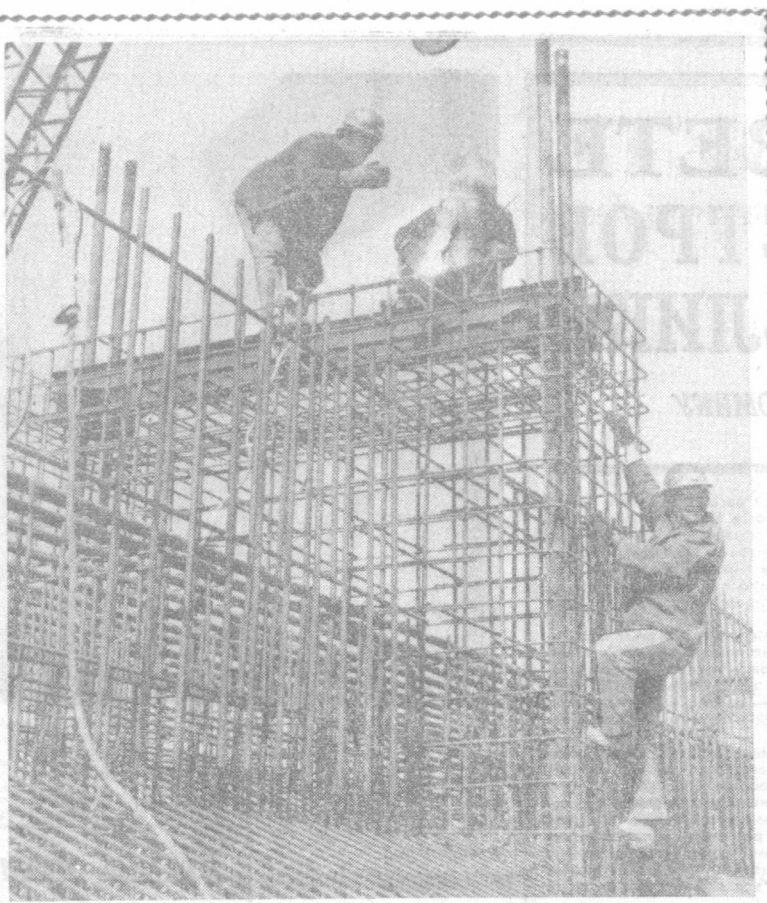
Самая крупная на востоке тепловая электростанция возводится неподалеку от истоков Южно-Городищенского канала. Мощность станции, которая будет работать на природном газе, составит почти 4,5 миллиона киловатт. Первый блок электростанции мощностью в 300 тысяч киловатт должен вступить в строй в 1972 году. Сейчас полным ходом идет бетонирование фундамента главного корпуса. На снимке: монтажники управляют спецработы ведут монтаж арматуры основания главного корпуса.

Шелководы Андижанской области досрочно выполнили повышенные социалистические обязательства, взятые в честь выборов в Верховный Совет Союза ССР. Они сдали на заготовительные пункты 230 тонн ценного сырья.