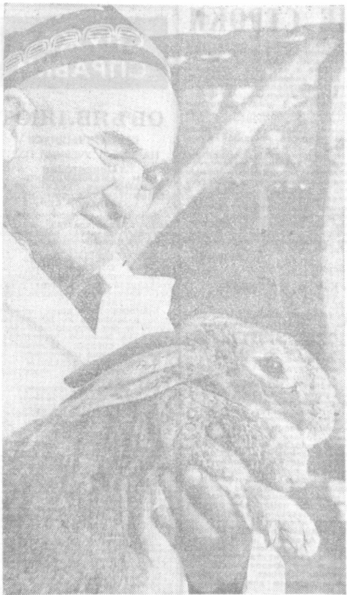
В колхозах и совхозах республики возродится скоростная сеть животноводства...