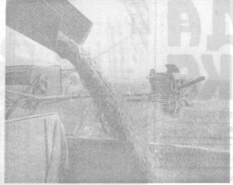
На полях Сырдарьинской области созрел отличный урожай колхозов. Хлеборобы торопятся провести уборку быстро и без потерь. Небывалый урожай позволяет многим хозяйствам сдать зерно государству в объеме полутора-двух годовых планов, с избытком обеспечить себя фуражом, семенами. Хозяйства области производят и свыше 140 тысяч тонн зерна. Успешно трудятся на уборке хлебов труженики совхоза «Замин-2» Заминского района. На полях этого хозяйства работает более 50 комбайнов, а сирора их число увеличилось до 70. Каждый комбайнер убирает за день хлеба с площади 15-16 гектаров и обмолачивает по 10-12 центнеров пшеницы с каждого гектара. На снимке: идет зерно нового урожая.

Совет Министров обязал райисполком добиться дальнейшего улучшения работы Советов и их исполкомов в области народного образования, культуры, здравоохранения, социального обеспечения, торговли и общественного питания, бытового и жилищного обслуживания населения, благоустройства и коммунального строительства на селе.