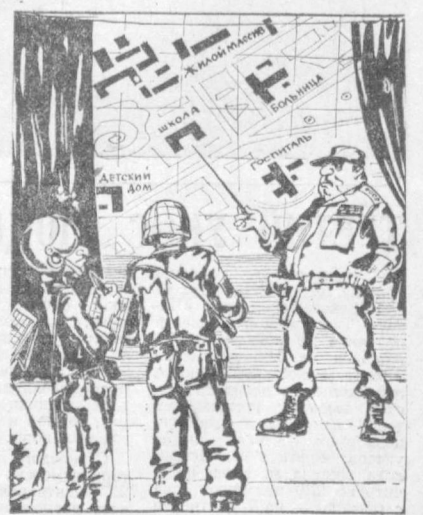
Израильский генерал: «Основной удар по этим стратегическим объектам, господая...» Рис. А. САФРОНОВА.