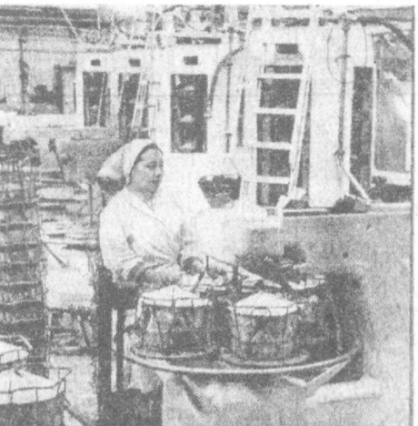
Водоулучшенные решениями майского Пленума ЦК КПСС работницы Ташкентского текстильного комбината взяли повышенные социальные обязательства на период до 1985 года. Сегодня на предприятии идет большая работа по переоборудованию производства новыми, более производительными...