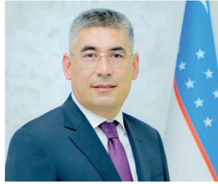
Avtokameral tizimi - tadbirkorlarga dastyor

Prezidentimiz tashabbusi bilan o'tgan yili mahalla institutining jamiyatimizda va aholi muammolarini hal qilishda birinchi bo'g'in sifatidagi roli oshirilib, mahalla raisi, hokim yordamchisi, xotin-qizlar faoli, yoshlar yetakchisi, profilaktika inspektori, soliqchi va ijtimoiy xizmat xodimidan iborat "mahalla yettilligi" tashkil etildi. Davlat xizmatchilari, xususan, soliq xizmati xodimlarining mahalla darajasiga tushib mahallabay ishlashi, har bir fuqaro, har bir subyektlar kesimida muammolarning hal qilinishi tadbirkorlar va aholiga keng qulaylik yaratmoqda.