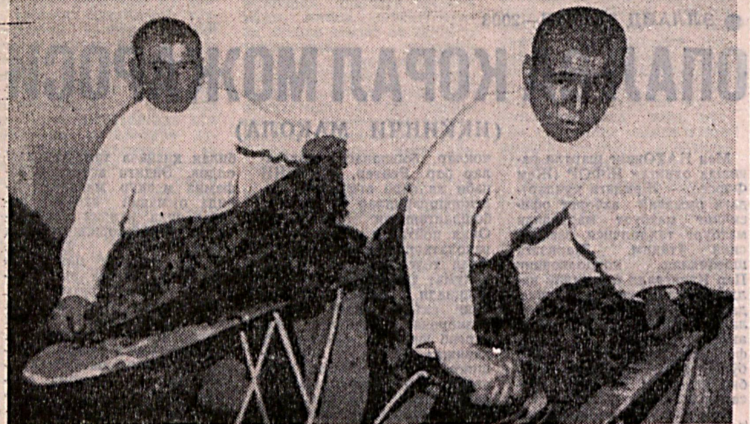
Аскарларнинг машини хизмат хонасига ҳеч қирғини йўқ. Бу ерда соҳил тартитига келтирилиб, пойабалани соғаллаш...