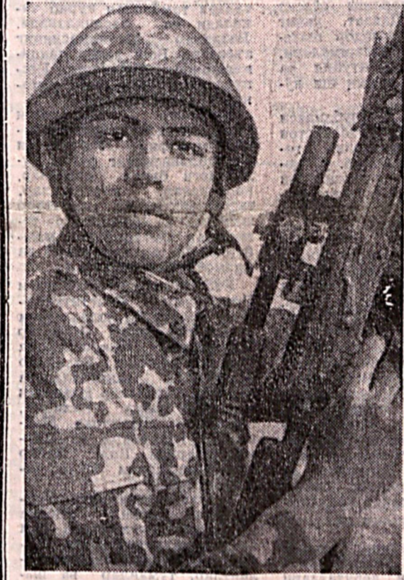
АНА ШУНАҚА, БИЗНИНГ ЕШ ДЕСАНТЧИЛАР!

ПУЛЬС ПЛАНЕТЫ Премьер-министр Израиля Ариэль Шарон заболел «простудой средней тяжести», сообщает израильское радио. В связи с этим Шарон отменил свое участие в ежегодной церемонии у мемориала первому премьер-министру страны Давиду Бен-Гуриону. Индия и Пакистан возобновили воздушные сообщения между двумя странами с 1 января 2004 года. Данное соглашение было достигнуто в результате двусторонних переговоров в Дели. Полиция Кении арестовала двух человек, которые подозреваются в организации взрыва в отеле города Момбасы год назад. Тогда жертвами терроризма стали 15 человек, в основном жители охранительных органов, задержанные являются членами «Аль-Каиды». Сирия передала Турции 22 задержанных по подозрению в причастности к терактам в Стамбуле. Об этом сообщает турецкое информационное агентство «Анадолия». По его данным, все выданные являются турками, которые прибыли в Сирию сразу после терактов в Стамбуле, совершивших с интервалом в пять дней, в результате которых погиб 61 человек. Президент международного фонда «Демократия» Александр Яковлев объявил, что после отставки президента Грузии Эдуарда Шевардnadze эта страна разделится на княжества или отдельные территории. Такое мнение Яковлев высказал в программе «Вести недели» телеканала «Россия». Испания продолжит выполнение своих миссий в Ираке несмотря на гибель под Багдадом семи испанских агентов разведки. С таким заявлением выступил премьер-министр Испании Хо-