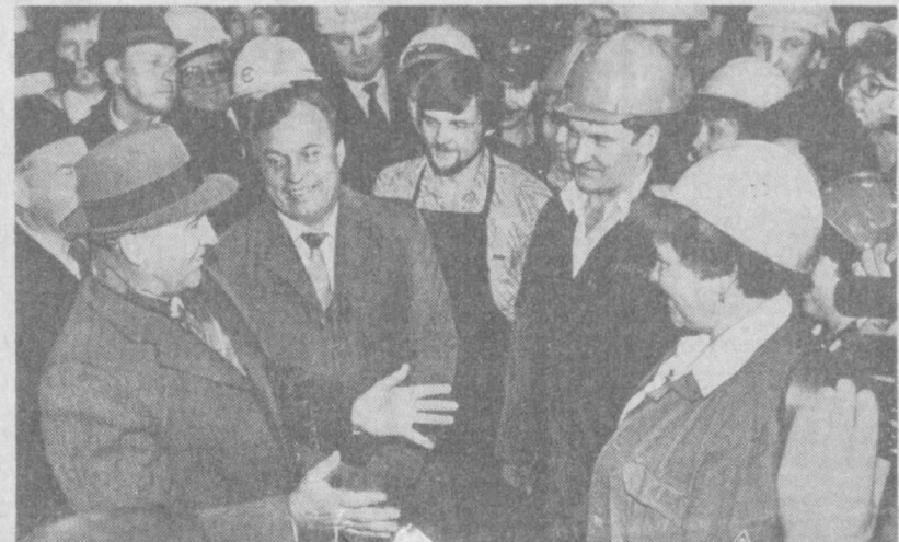
Во время беседы с рабочими комбината «Североникель» имени В. И. Ленина (г. Мончегорск). Телефото ТАСС.