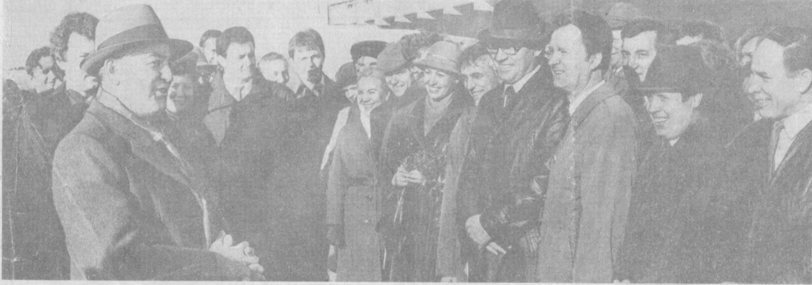
Во время встречи с жителями Мурманска.

Встречи М. С. Горбачева с трудящимися Мурманской области