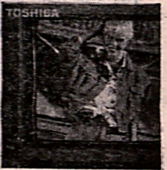
дан фойдаланишни бошлайдди.

Янги тизимда илк бор тажриба сифатида синаб кўрилатган телевидение кўрсатувлари кейинчалик бутун мамлакат ҳудудида йўлга қўйилади. Янги тизимга ўтиш жараёни 2006 йилнинг охиригача давом этади. 2011 йилнинг июль ойида бошлаб эса мамлакат расман рақамли телевидение-