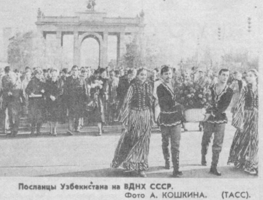
Посланцы Узбекистана на ВДНХ СССР.