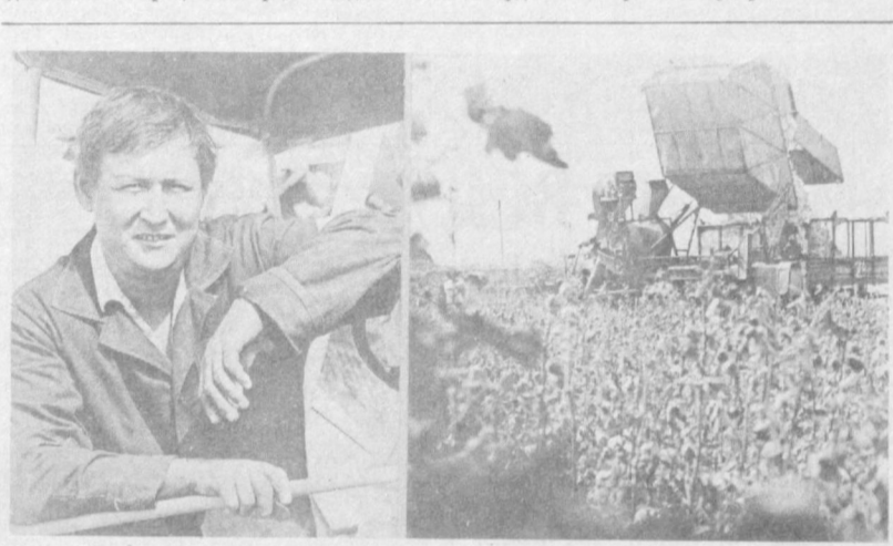
С первого же прохода хлопкоуборочные машины в совхозе «Янгир» Мехнатбадского района сняли по 19 центнеров с гектара. Хлопкоробы полны надежд, что отдача целинного гектара достигнет и всех 25 центнеров.