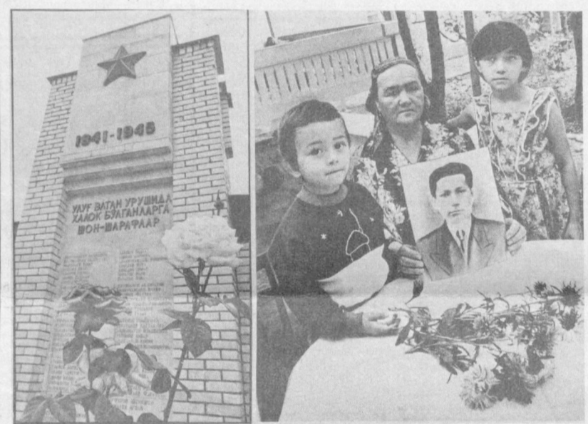
● НИКОТО НЕ ЗАБЫТ, НИЧТО НЕ ЗАБЫТО