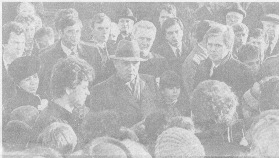
Во время беседы с ленинградцами.

Все ближе дыхание нашего главного праздника. Революция и сегодня живет в нашем сознании, в наших делах, в том обновлении, которое партия, выражая волю народа, сделала кровным делом миллионов.