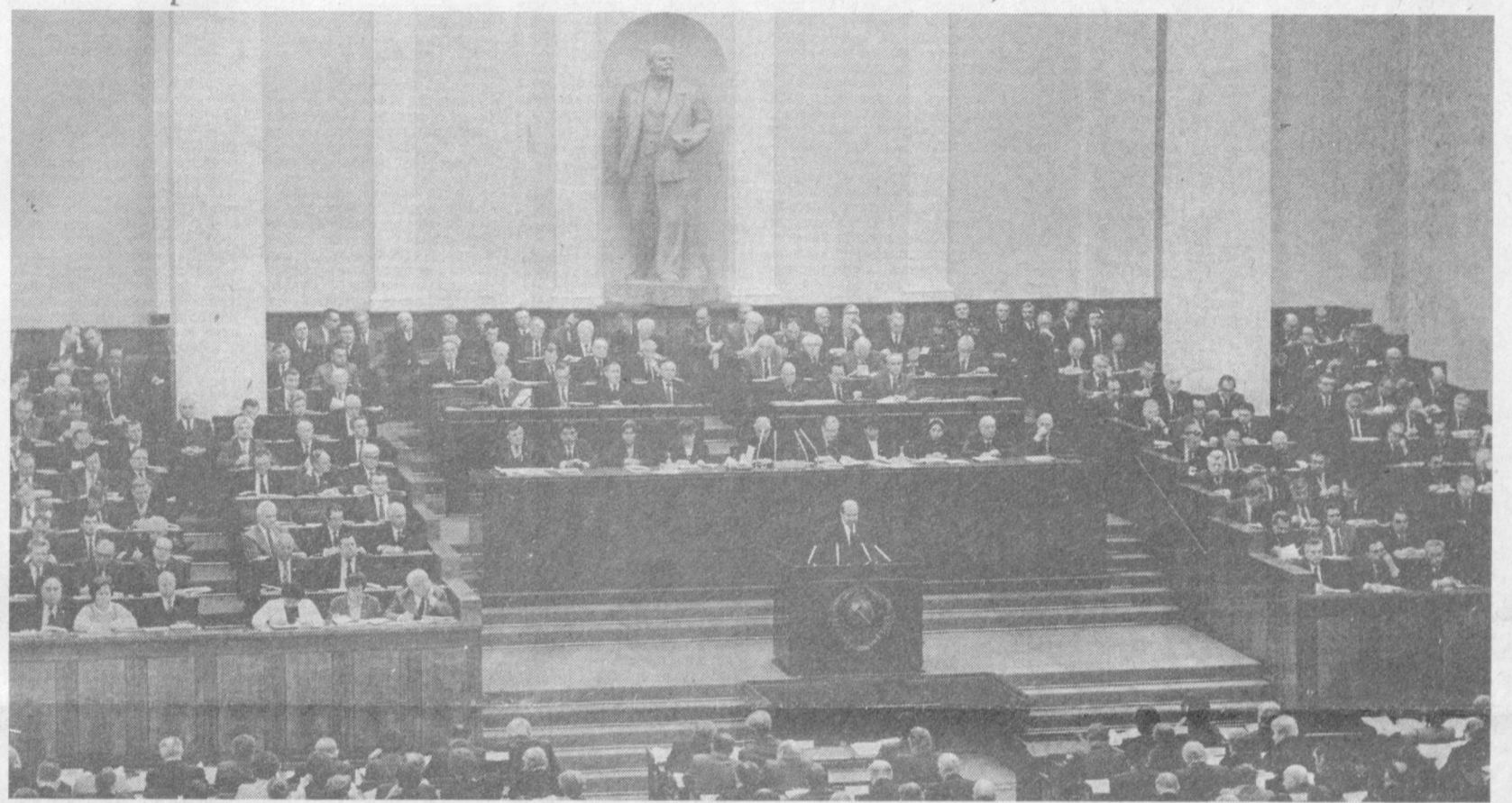
Восьмая сессия Верховного Совета СССР одиннадцатого созыва. Совместное заседание Совета Союза и Совета Национальностей.

Основным источником повышения национального дохода является ресурсосбережение. Почти 80 процентов произведенной продукции должно быть обеспечено за счет эконо-