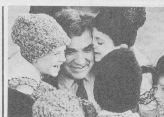
Яркие и поэтические книги Спиридона Вангели полюбились юным читателям не только в Молдавии. Они переведены на многие языки народов нашей страны, изданы в Болгарии, ГДР, Чехословакии, Монголии, США, Японии. Рассказы о маленьком Гугуце из села Трое Козляк получили высокую оценку Международного совета по детской литературе. Сборник «Дедушкин министр» награжден почетным дипломом имени Андерсена. НА СНИМКЕ: заслуженный деятель искусств МССР писатель С. С. Вангели с воспитанниками кишиневского детского сада «Альбицца».

— Мне нравится, когда люди улыбаются, — говорит художник, — улыбка делает их добрее, внимательнее друг к другу, а значит, и счастливее. Давайте же дарить друг другу счастье!