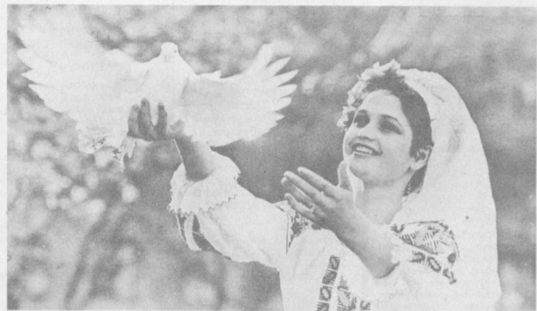
Миром и дружбой встречает Молдавия дорогих гостей. Кишинев, Проспект Ленина. На излучине Днестра. Рукопожатие дружбы.

Приоритетное развитие машиностроения в нынешней пятилетке поставило перед предприятием серьезную задачу — увеличить выпуск новой техники вдвое. И здесь хорошо понимают: от этого зависит не просто обновление станочного парка многих отраслей, от этого зависит наш завтрашний день. Тирасполь.