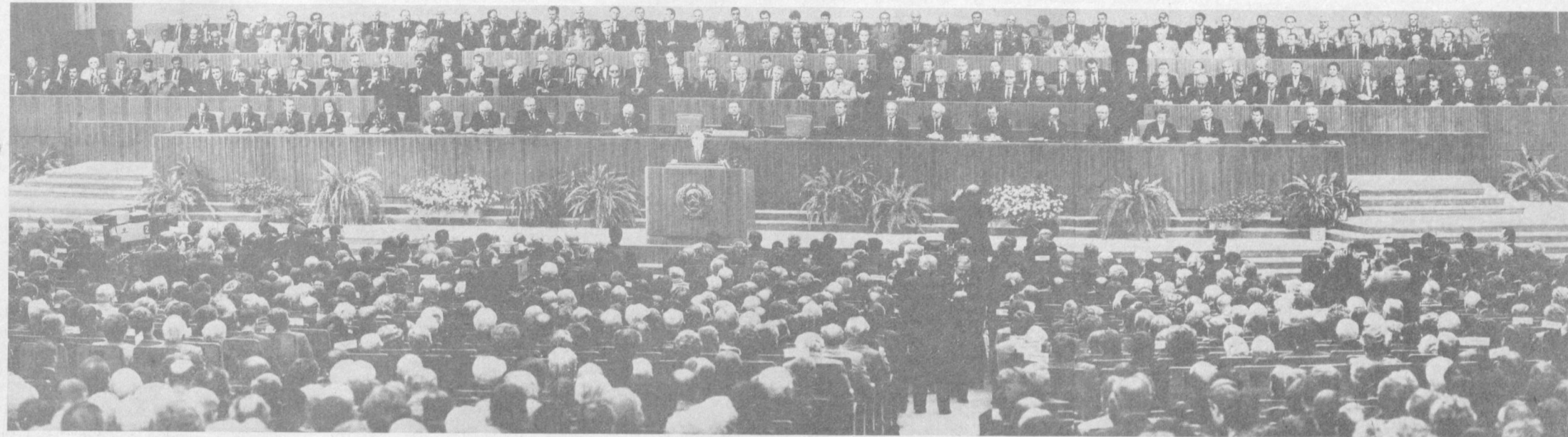
МОСКВА, КРЕМЛЬ, 2 ноября 1987 г. Совместное торжественное заседание Центрального Комитета КПСС, Верховного Совета СССР и Верховного Совета РСФСР, посвященное 70-летию Великой Октябрьской социалистической революции.

С докладом «Октябрь и перестройка: революция продолжается» выступил Генеральный секретарь ЦК КПСС М. С. Горбачев.