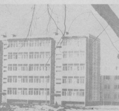
1983 йилда пойттахтимизда турар жой қурилиши янада жадал давом эттириляпти. Юнусовд массивининг кенжа микрорайонида ўтган йили 12 та беш қаватли турар жой биноси қурилды. Бунда «Жилстрой» трестининг 40 нафар беш қармас биночилари катта жонбозлик кўрсатди.