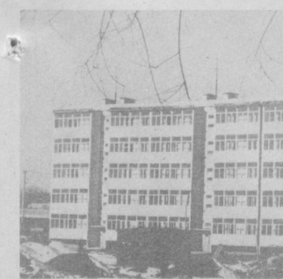
1983 йилда пойттахтимизда турар жой қурилиши янада жадал давом эттириляпти. Юнусовд массивининг кенжа микрорайонида ўтган йили 12 та беш қаватли турар жой биноси қурилды. Бунда «Жилстрой» трестининг 40 нафар беш қармас биночилари катта жонбозлик кўрсатди.