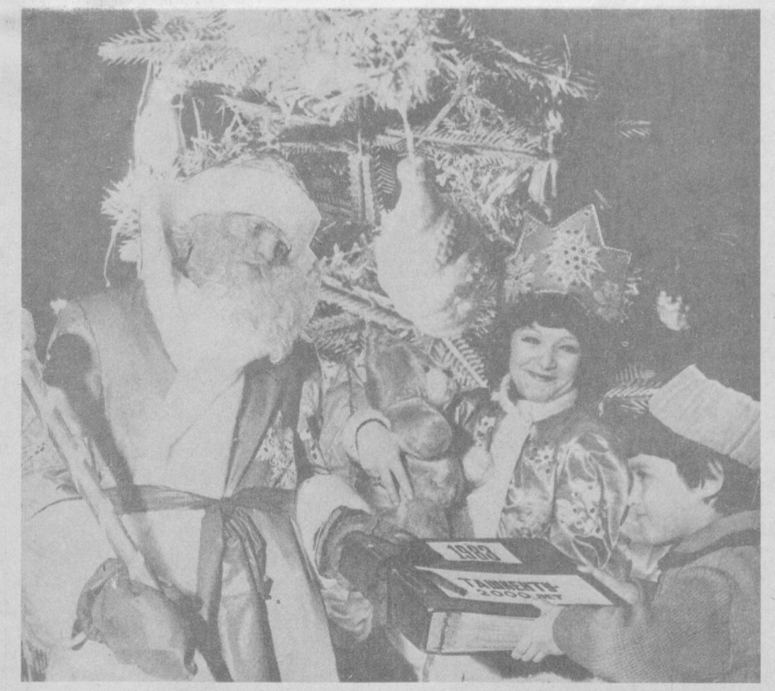
Тошкентнинг 2000 йиллигига юбилей астафетасини қабул қил, Янги йил!

Музаяна АЛАВИА, ССР Давлат мухофотининг лауреати, олма-шоира. Уқинлар деб, улуг ҳўқиди хитоб. Ўқимасанг умринг ўтар худди бетоб. Илму-хўнарларининг юзи худди офтоб. Бу отангининг қарилғи кулфат экан. Тошкент шаҳри жуда улуг олий ҳўimmat Оға-ини барин кўрсанг турли миллат. Келин-қизга ярашади зебу-зийнат Ой жамолин оширади қилиб ҳўzimат Бахти борни дўстлаштирган меҳнат экан. Исломотанг қадр топди айтиб дoston Қулоқ солди қўшиғига ишчи-деҳқон. Созу-сўзи бирга бўлиб сурди даврон Ота-бобом орзу қилган яхши замон. Бу отанга энг яхшилар улфат экан.