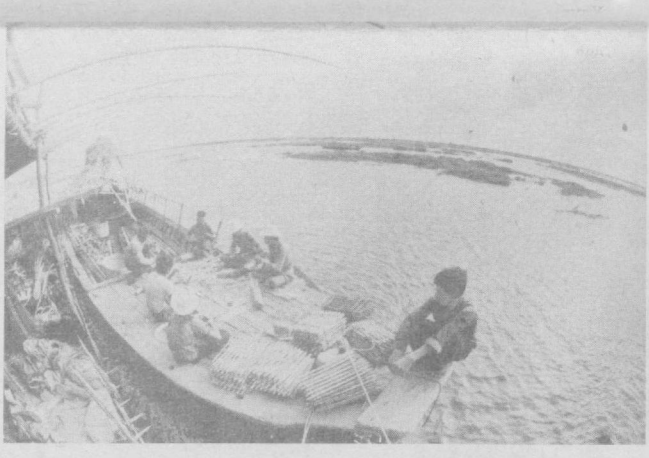
Нампучия Халқ Республикаси. Мамлакатда энг йиртик бўлган Томлесан денгиз балиқчилари ҳар йили Нампучия Халқ Республикаси аҳолиси учун қимматбах озин-овнат маҳсулоти ҳисобланган балиқдан 8—10 минг тонна овланади.

ЖИНОЯТЧИЛИК Кўпаймоқда РИМ. Италия пойтахтида жиноятчилик жуда кўпайиб кетаяти. Мамлакат шикоят суди бироқ прокурор Ж. Тамбурино айтган маълумотларга қараганда, 1981 йилда 2,341 қотиллик қайд этилган. Бу — шундан аввалги йилга нисбатан 18,4 процент кўп, худди шу давр ичда ўғирликлар миқдори 15,7 процент кўпайган.