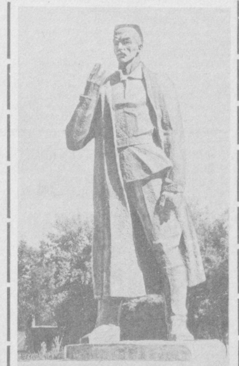
Ҳамзаҳонлик кунлари анъанана бироин мана шу ерда, Октябрь куйчисига ўрнатилган ҳайкал олдидан бошланади.

ЯНГИ ҲАЁТ КУЙЧИСИ Эртага республикамызда анъанавий ҳамзаҳонлик кунлари бошланади. Бу кунлар инқилобнинг оташин куйчиси, ўзбек совет адабиётининг асосчиси Ҳамза Ҳакимзода Ниёзий тугилган куннинг 94 йиллигига бағишланади