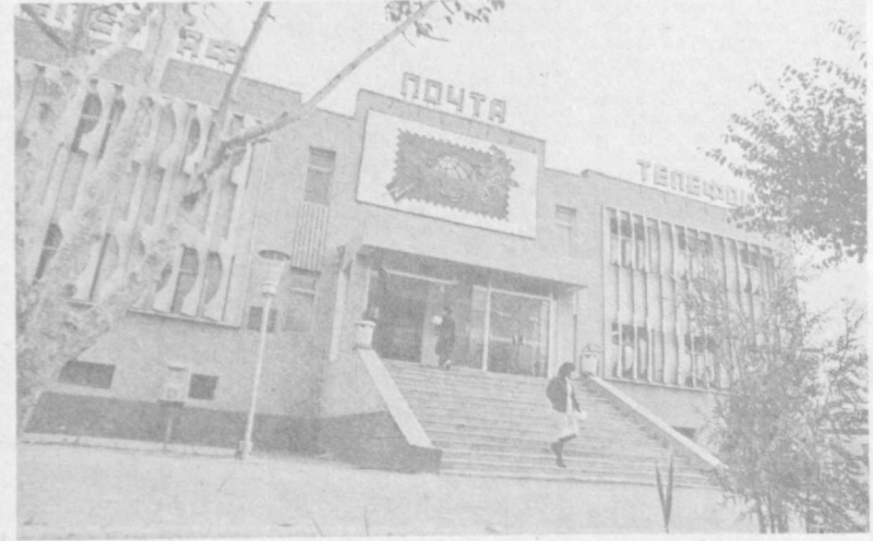
ХОРЕЗМСКАЯ ОБЛАСТЬ. В районном центре Ханин сдан в эксплуатацию новый Дом связи. Здесь АТС на три тысячи номеров, почта, телеграф, междугородная телефонная станция, радиозвездь. НА СНИМКЕ: новый Дом связи.