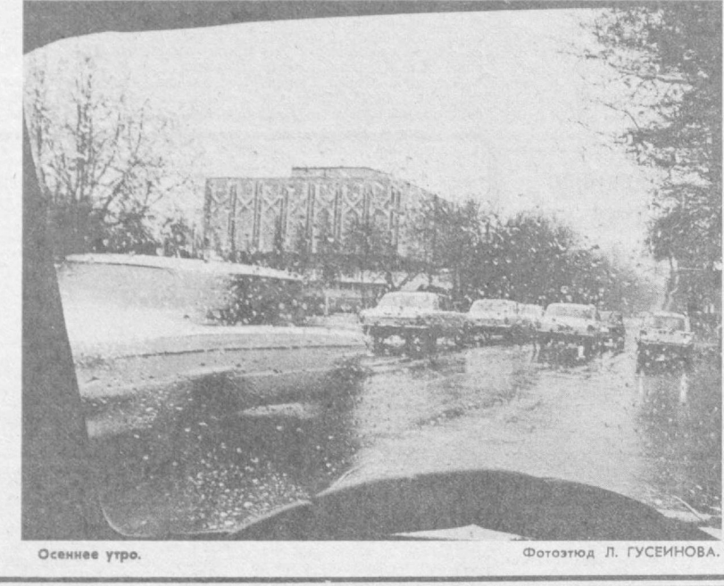
Осеннее утро.

Театр, коллектив постоянно обновляется молодежью. Совсем недавно пришла группа выпускников Горьковского театрального училища и Ростовского училища искусств. Почти все они заняты в спектаклях, которые мы привезли в Ташкент. — Расскажите о спектакле. — Это рок-опера «Собаки» по мотивам повести К. Сергиенко «До свидания, Овраг». Появление ее в репертуаре театра не случайное. Молодежный театр не может не волновать проблемы молодых, которым так сложно найти свое место в жизни, которые ищут понимания и сочувствия, но при этом часто склонны не принимать мир взрослых. Наш спектакль о неблагополучных подростках, объединенных в группу, противостоящую окружающему им миру, внешне агрессивной, но при этом беззащитной, не имеющей опоры и какой-то четкой позиции. Исследования их микромра и представляет для нас интерес. Кроме того, нас очень интересует и такое социальное явление, как рок-культура, к которой можно относиться по-разному, но не признавать ее существование.