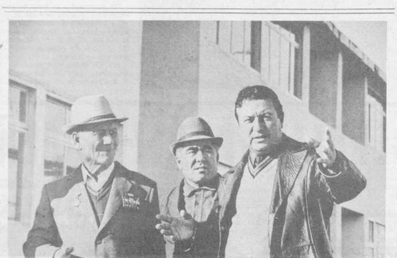
В районном центре Ханки появилась новая, шестьдесят вторая по счету улица — «70 лет Октября». Она проложена при содействии народных избранников по наказам избирателей. Вдоль улицы расположились красивые двухэтажные дома, школа, магазин, детский сад. Новая городская магистраль асфальтирована, она интенсивно благоустраивается, а работа участвуют и специализированные организации, и сами жители.