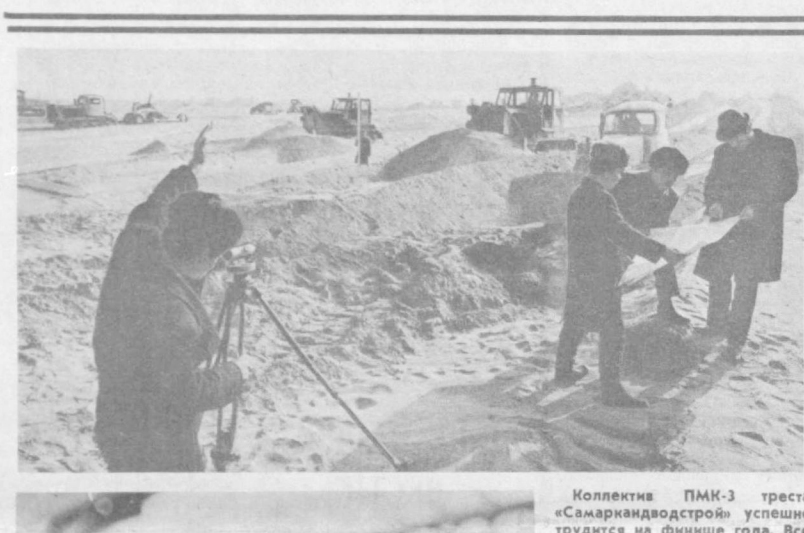
Коллектив ПМК-3 треста «Самаркандострой» успешно трудится на финише года. Все работы по улучшению поливной земли выполняются в срок. Это значительно улучшит к будущему сезону водобеспеченность хозяйств района. Ввод трех насосных станций позволит прибавить и орошаемым землям Ургутского района еще 1.200 гектаров.

М. ЭМИРСУЕИНОВА. Зав. сектором информации отдела оргпартиработы Сырдарьинского обкома партии.