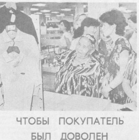
ЧТОБЫ ПОКУПАТЕЛЬ БЫЛ ДОВОЛЕН