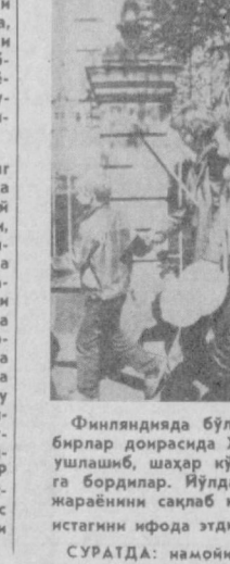
Финляндияда бўлиб ўтган «Тинчлик ва умид баҳори» шiori остидаги урушга қарши тад-бирлар доирасида Хельсинки шаҳрида оммавий намойиш ўтказилди. Унинг қатнашчилари кўл ушлашиб, шаҳар кўчалари бўйлаб аянуловчи анга имзо чекидан давлатларнинг элчиюнаварли-га бордилар. Йилда уларга ҳайрхоҳлар кўш илдиши. Намойишчилар кескиликни юшатиш жараянини сақлаб қолиш, АҚШ ва НАТО аср олдирётган қуролланиш пойсағига чек қўйиш истагини ифода этдилар.

Финляндиянинг Йозсу шаҳрида музика ва кўшиқ анъанавий байрами бошланди. «Финляндиянинг музи-каси» ёзиб доирасида ўтаётган ана шу ома-вий маданият тадбири қатнашчилари орасида кўпгина мамлакатлар-нинг бутун жаҳонга машхур хор ва музика коллективлари бор. Бу ерда Совет Иттифоқи-дан ҳам хизмат кўрса-тган икки ижодий коллектив — Эстония ССР давлат академик эрн-каллар хори ва Вильно давлат филармонияси оркестри қатнашмоқда.