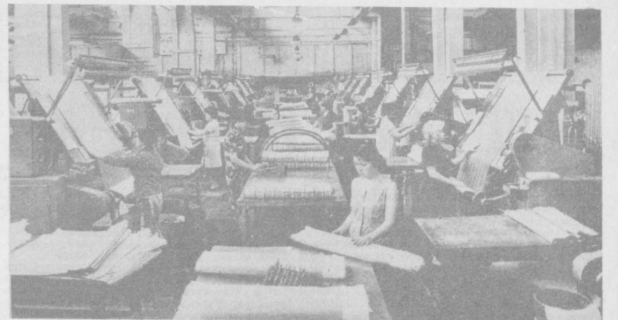
Тошкент тўқимачилик комбинати Фрунзе райондаги эңг йиринг корхоналардан бири. Унинг маҳсулотини республика маҳзагина эмас, ундан ташқарида ҳам яхши маълум.